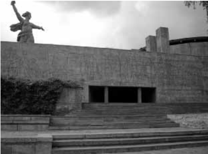
Am Mamajew-Hügel mit der Mutter Heimat. Eingang in die 'Halle des Kampfesruhms'