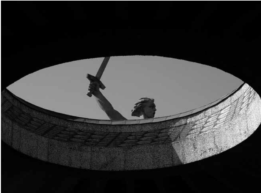
Mamajew Kurgan: Blick aus dem 'Saal des Kampfesruhms' auf die Statue 'Mutter Heimat'