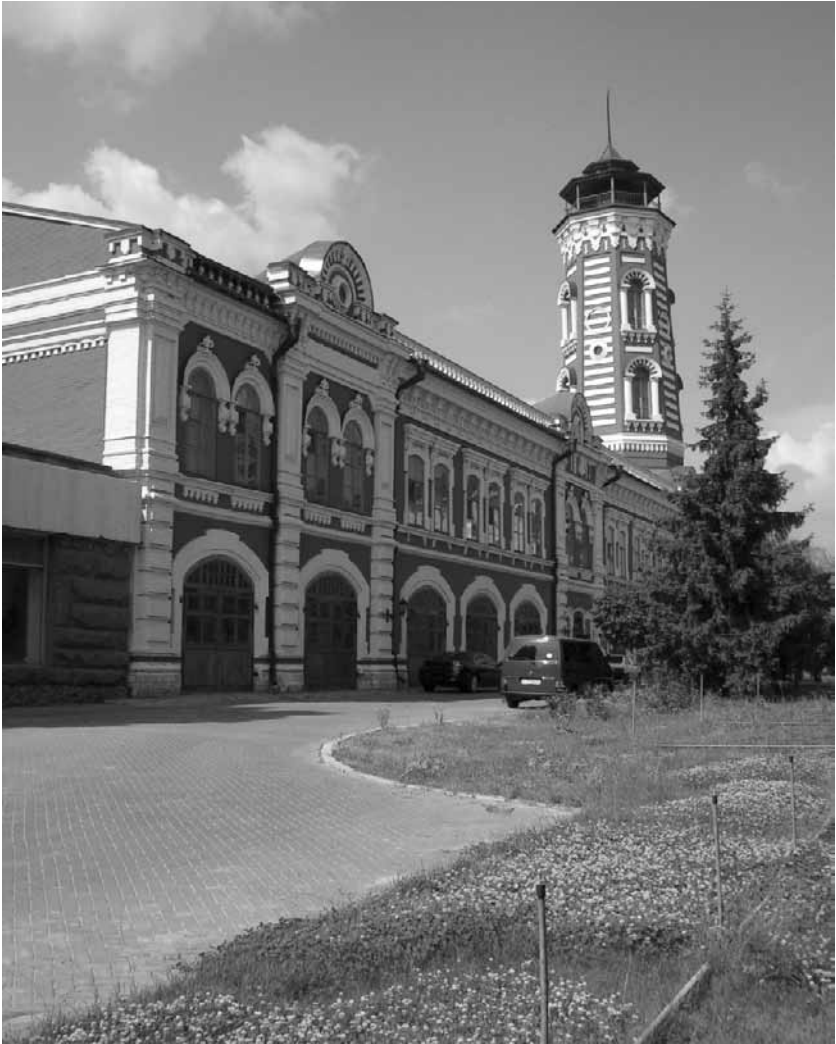
Die restaurierte alte Feuerwache in Wolgograd