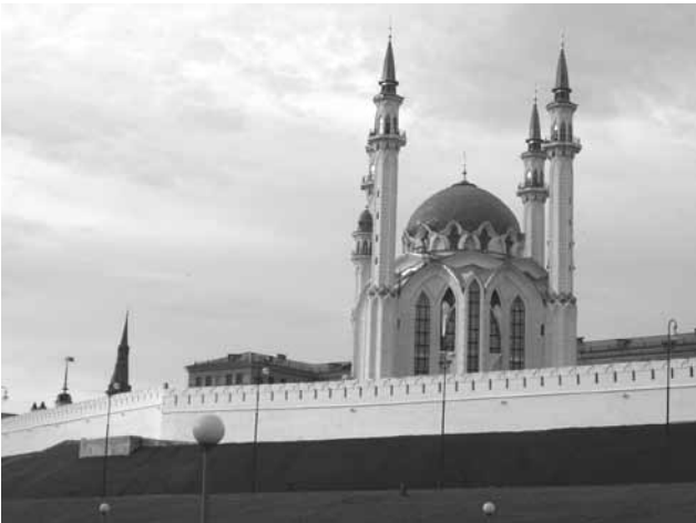
Die neue ›Kul-Scharif-Moschee‹ im Kasaner Kreml

Im Zentrum der Reise aber stand die Anlandung des Schiffes in Wolgograd, wo sich die „Besatzung“ mit vielfältigen politischen, musikalischen und sonstigen kulturellen Beiträgen aktiv an der Ausgestaltung der „Deutschen Tage“ beteiligte. Ihre Bedeutung für die deutsch-russischen Beziehungen geht schon daraus hervor, daß beide Seiten auf einer Reihe von Veranstaltungen hochrangig vertreten waren: Gouverneur Maksjuta und Oberbürgermeister Ischtschenko auf russischer, Botschafter von Ploetz auf deutscher Seite. In ihren Reden fand auch die Partnerschaft unserer Städte lobende Erwähnung. In kurzen Gesprächen