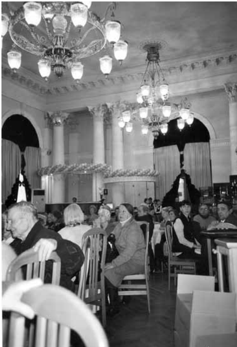
Blick in den Saal des Hotels ›Wolgograd‹

Briefkasten des Vereins, häufig von Gratulationen und bewegenden Kommentaren begleitet. In den folgenden Tagen erreichten uns aus aller Welt weit über 500 Bestellungen über Telefon und Internet, mehr als die Erstauflage hergab. Daraufhin wurde sehr schnell eine Neuauflage vorbereitet und den Interessenten das Buch zum Kauf angeboten (Exemplare der Erstauflage waren gegen Spende abgegeben worden). Auch weiterhin wurde um Spenden für hilfsbedürftige ehemalige ZwangsarbeiterInnen gebeten – mit beträchtlichem Erfolg.