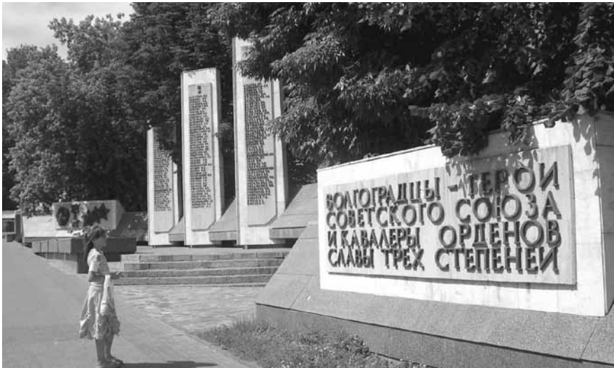
Erinnerungstafeln an die Stalingrader Schlacht auf der Alleja Gerojew

Drei Tage – randvoll mit Eindrücken. Schön, daß das Programm auch noch Zeit ließ, Freunde und Bekannte in Wolgograd zu besuchen. Eindrücke, die wie meistens zu denen gehören, die am nachhaltigsten sind.