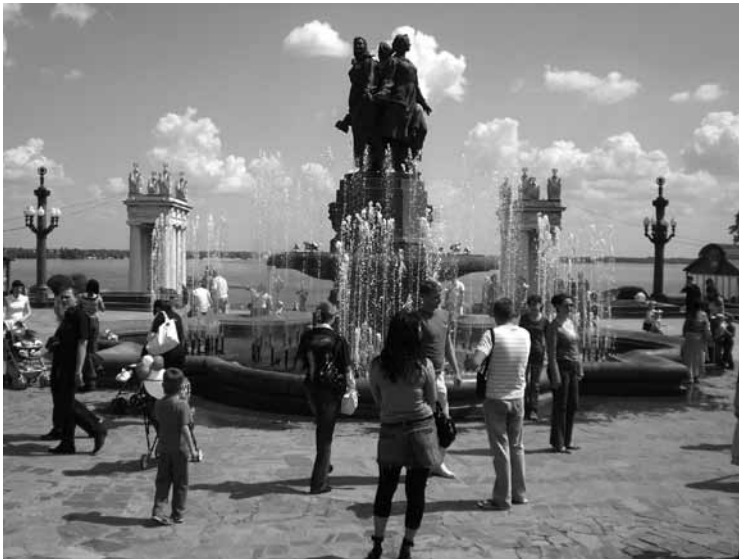
Ein beliebter Treffpunkt für Jung und alt in Wolgograd: Der Brunnen der Kunst im Zentrum der Stadt

Beiträge und Informationen bitte an: Doris Jung [Adressenangabe]