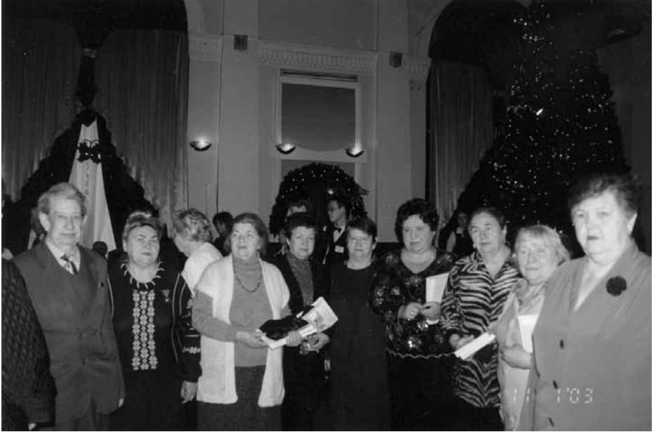
Gruppenbild der Autorinnen

(Weihnachten und Silvester) war es uns gelungen, die Bücher rechtzeitig zum vorgesehenen Termin – 11. Januar – nach Wolgograd zu transportieren. Und dank glücklicher Umstände war es auch mir gelungen, Wolgograd zu erreichen, allerdings auf dem Landweg, nachdem der Flughafen wegen Nebel tagelang geschlossen war.