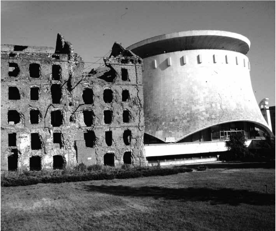
Das Panorama-Museum mit der Grudinin-Mühle.