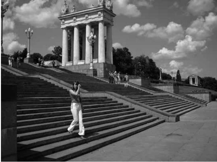
Für die meisten Wolgograd-Besucher das erste Ziel: Die Kai-Treppen zur Wolga