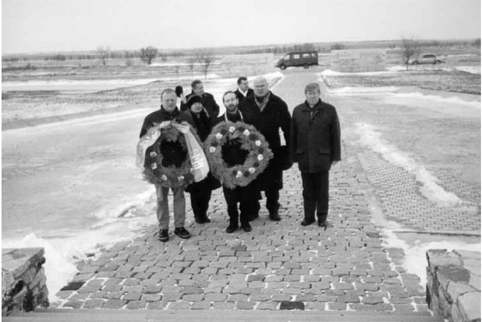
Kranzniederlegung auf den Friedhöfen von Rossoschka

Als protokollarisch ranghöchster Kölner hatte ich nun fortan die Aufgabe, die Stadt Köln bei allen Feierlichkeiten, quasi in der ersten Reihe, zu vertreten. Meine Wodka-„Schluckimpfungen“ im Deutzer Lokal „Hotel-Lux“ sollten sich jetzt auszahlen. Abends fand dann ein feierlicher Festakt im städtischen Musiktheater statt. Zu diesem Festakt waren auch alle noch lebenden und hoch dekorierten russischen Stalingrad-Veteranen eingeladen. Gegen Mitternacht trafen dann die Delegationen aus Coventry, Dijon, Lüttich und Chemnitz im Hotel ein. Von den Kölnern erfuhren wir später, dass sie die ganze Nacht vergeblich auf den Weiterflug nach Wolgograd gewartet hatten und dann entschieden hatten, wieder nach Köln zurückzufiegen. So war klar, dass ich auch weiterhin die Stadt Köln in Wolgograd alleine vertreten musste. In der Kölnischen Rundschau war am Folgetag die Schlagzeile zu lesen: „Schlaflos in Moskau oder: Nicht so flott mit Aeroflot“.