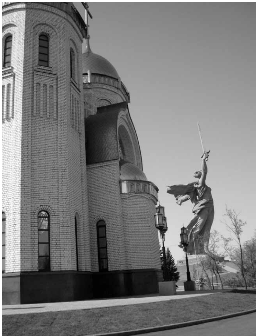
Die neu erbaute Kirche 'Allerheiligen' auf dem Mamajew Hügel