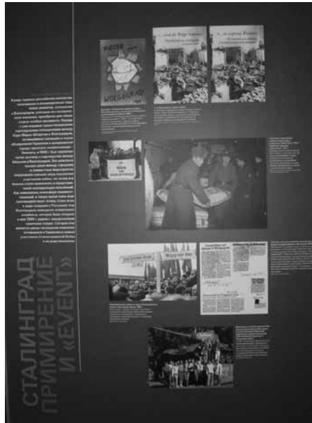
Die Städtepartnerschaft Köln-Wolgograd in der Ausstellung „Stalingrad erinnern“