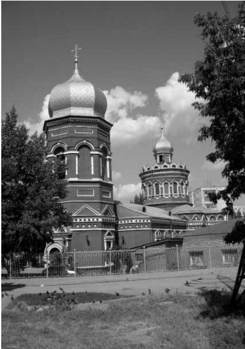
Die Kasanskij-Kathedrale in Wolgograd